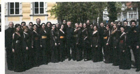
Coro da Camera di Torino