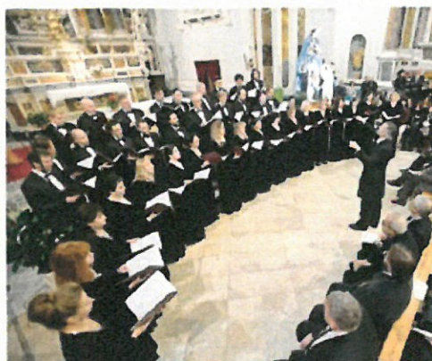
Coro Sinodale Di Mosca (Russia)