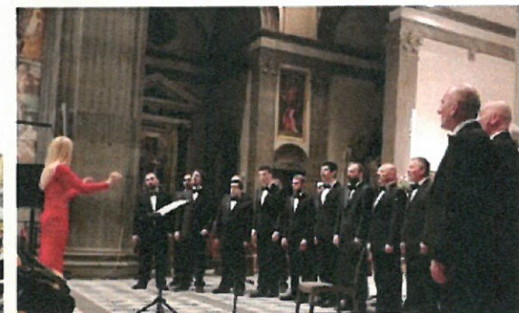
Coro Polifonico Di Ruda (Udine)