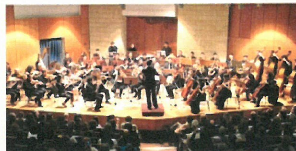
Orchestra Sinfonica del Conservatorio