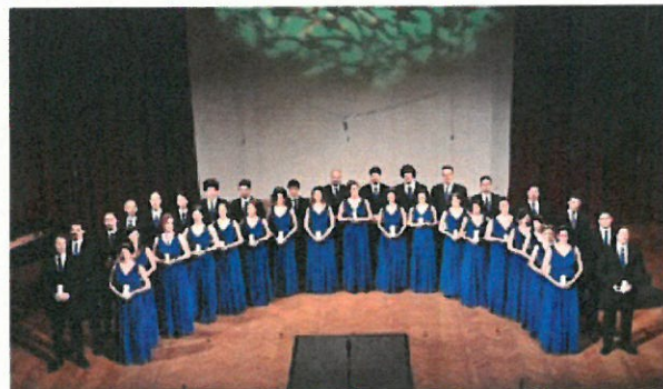
Coro Musicanova (Roma)

Orchestra Sinfonica del Conservatorio E. R. Duni di Matera